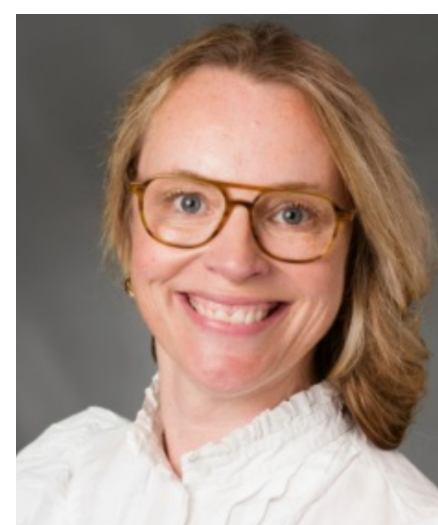
Christina Søgaard Indskoling og SFO